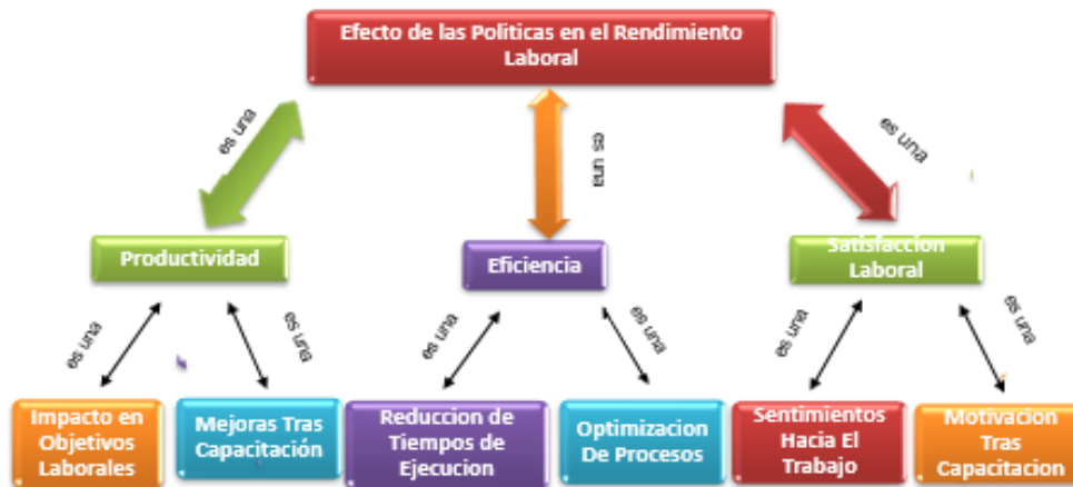
Figura 2. Efecto de las políticas de formación y desarrollo en la productividad y satisfacción laboral.