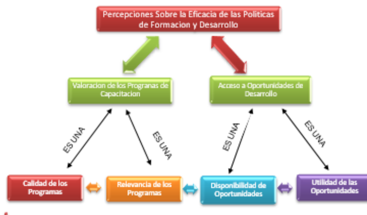
Figura 1. Relación entre las percepciones sobre la eficacia de las políticas de formación y desarrollo y sus componentes.

La figura 1 ilustra cómo estas percepciones están interconectadas y enfatiza la importancia de evaluar tanto la valoración de los programas de capacitación como el acceso a oportunidades de desarrollo.