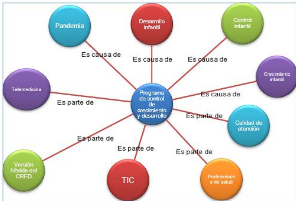
Figura 1. Red semántica. Elaboración: Los autores.

De los resultados obtenidos, se cimenta la propuesta relacionada con el diseño de un modelo sostenible para el CRED en la era post – pandémica; es así como para justificar más la investigación mostramos los resultados obtenidos en el Atlas TI, detallando la interrelación de diversos elementos dentro del CRED.