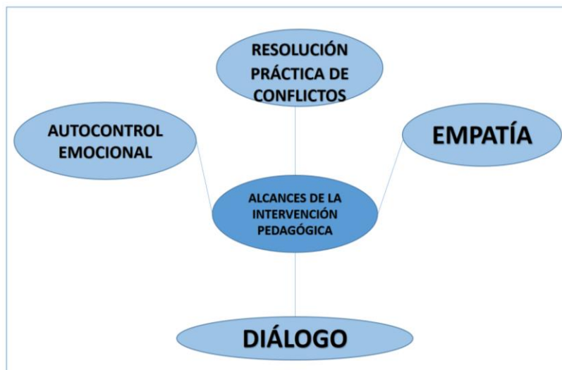
Figura 1. Alcances de la intervención pedagógica. Elaboración: El autor.

Por otro lado, los siguientes resultados representan una configuración de cada uno de los alcances observados durante y luego de la intervención pedagógica, sustentados en la empatía, el diálogo, el autocontrol emocional y la resolución práctica de conflictos. Tales aspectos son detallados en la figura 1 y descritos a profundidad.