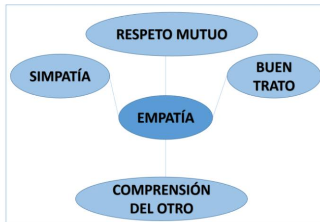
Figura 2. La Empatía. Elaboración: El autor.

En atención a la figura 1, se despliegan los factores evidenciados durante la observación pedagógica, resaltando que cada uno de ellos contribuyó a la sana convivencia, sobre todo, del grupo experimental.