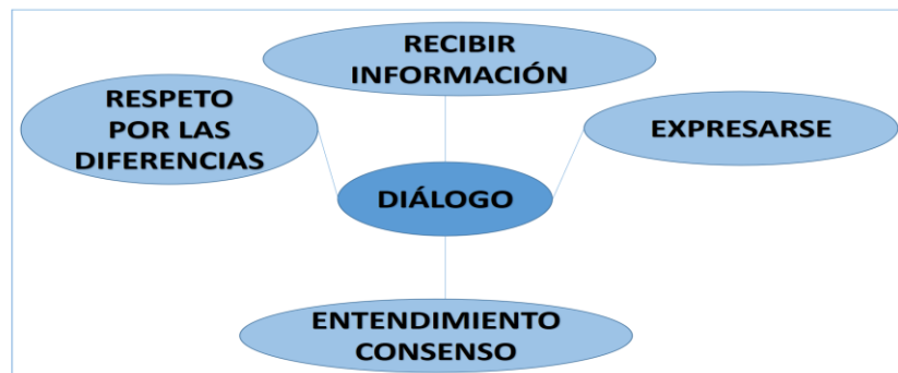
Figura 3. El diálogo. Elaboración: El autor.

La figura 2, muestra la empatía como uno de los factores favorables de la convivencia escolar, ya que supone el buen trato, el respeto mutuo, la simpatía y la comprensión del otro. Tales aspectos fueron observados en el grupo experimental mediante las acciones desarrolladas en el proceso formativo socioemocional.