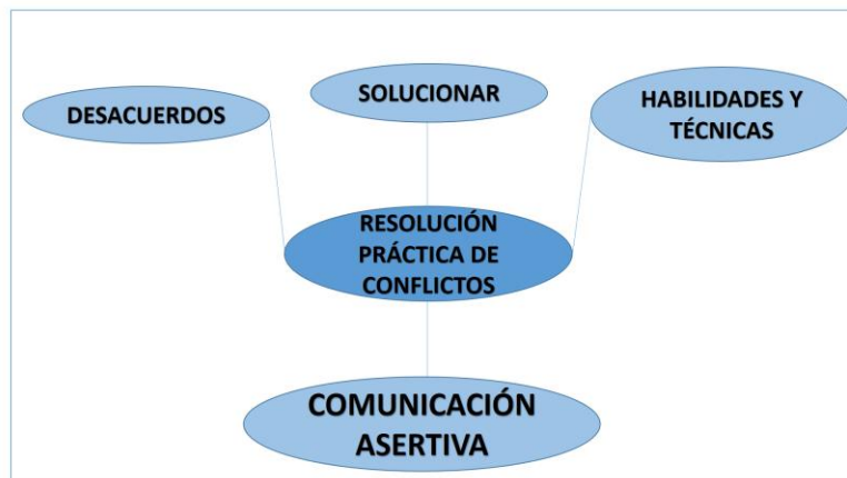
Figura 5. La resolución práctica de conflictos.

La figura 4 describe otro de los aspectos influyentes en la convivencia escolar, el cual es el autocontrol, factor que implica el reconocimiento, la gestión y la regulación de las emociones positivas y negativas.