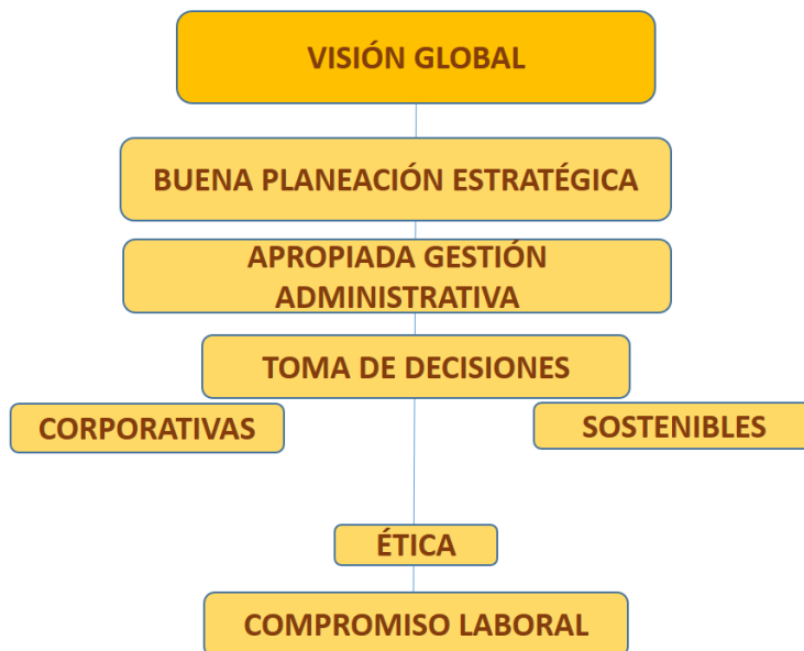
Figura 3. Visión global.

Es propicio señalar que, para este alcance, las corporaciones deben ir de la mano con los entes gubernamentales a objeto de ejecutar acciones desde el bienestar de una nación y de su progreso.