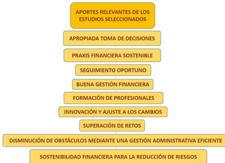
Figura 2. Categorías resultantes de los aportes de cada estudio.

Con base en lo presentado en la tabla 1, los artículos analizados sostienen una serie de categorías que emergieron de cada aporte, los cuales centran su atención en la superación de los obstáculos y el avance empresarial mediante un trabajo en conjunto fundamentado en una planeación estratégica y una gestión financiera acorde a los cambios y demandas de la realidad circundante. Tales categorías son especificadas a continuación.