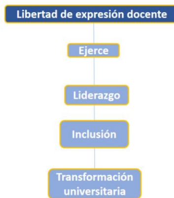
Figura 8. Libertad de expresión docente.

De acuerdo con la figura 7, Sáez (2024) invita a superar las barreras que impiden la libertad de expresión en las universidades para lograr construir una mejor calidad educativa.