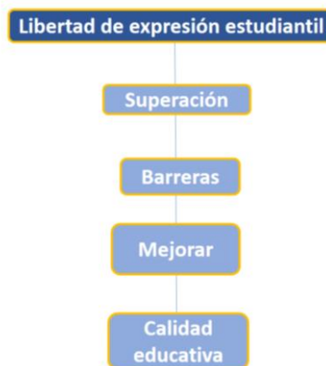
Figura 7. Libertad de expresión estudiantil. Elaboración: El autor.

De acuerdo con la figura 6, Medina et al. (2024) expresan que el consenso se logra mediante la libre expresión de opiniones entre las partes involucradas.