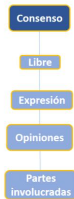
Figura 6. Consenso. Elaboración: El autor.

Según la figura 5, López (2024) propone una toma de decisiones que, mediante la retroalimentación, conduzca al consenso desde una acción constructiva y compleja.