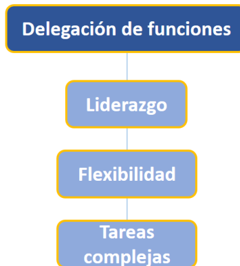
Figura 4. Delegación de funciones. Elaboración: El autor.

En correspondencia con la figura 3, Hagenauer et al. (2023), afirman que la buena relación docente-alumno incrementa el respeto y el apoyo entre ellos, conduciéndolos a contribuir con el alcance de la calidad educativa.