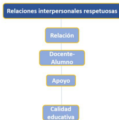
Figura 3. Relaciones interpersonales respetuosas.

Según la figura 2, Holcombe et al. (2025) afirman que el liderazgo sustentado en la equidad promueve cambios positivos a nivel personal, institucional y cultural.