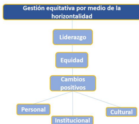
Figura 2. Gestión equitativa por medio de la horizontalidad.

De los estudios antes detallados (Tabla 1), emergieron aspectos como la gestión equitativa, las relaciones interpersonales respetuosas, la delegación de funciones, la toma de decisiones, el consenso y, finalmente, una síntesis del liderazgo democrático en estudiantes de la educación superior; aspectos abordados en las siguientes figuras.