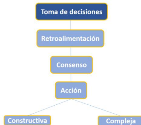
Figura 5. Toma de decisiones. Elaboración: El autor.

De acuerdo con la figura 4, Dionísio et al (2022) destacan que la delegación de funciones en un liderazgo conduce a la flexibilidad para llevar a cabo tareas complejas.